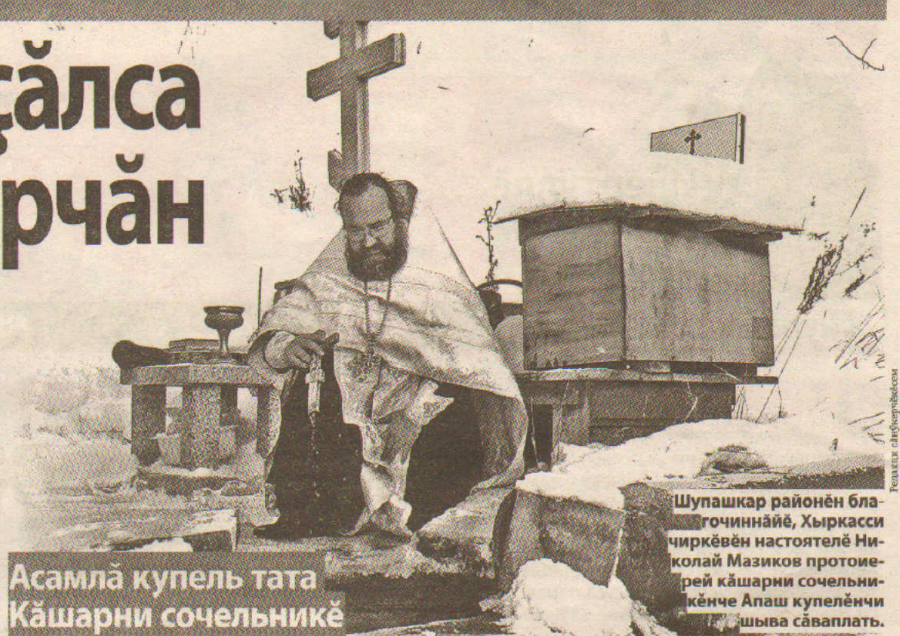
Асамла купель тата Кашарни сочельникё

Апашри светтуй Пантелеймон ячёпе усна купеле сўрекенсен йышё сулсерен нумайлапаты. Апаш чиркў-прихучён настоятелё Анатолий Тюбек апа сапла аплантарать: «Пурте Тура ирёкёпе пулса пыраты. Иоанн Креститель Иордан шывёнче сынисене шыва кёрсе сьлэхёсене карттарма, йёркеллэ, ыра сул сине тәма чёне. Унта 30 султи Иисус Христос та пыраты. Вәл шыва кёне вәхәгра тўпе усаьлса каяты, светтуй сывлаш шывак кавакарчән пек пулса сёр сине анать. Сўлтен тата сас пулаты.