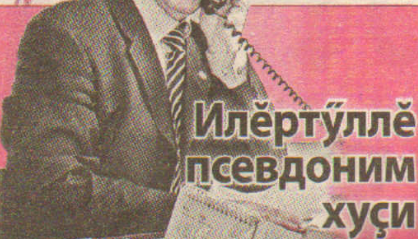
Ил'ертүллэ псевдоним хуסי