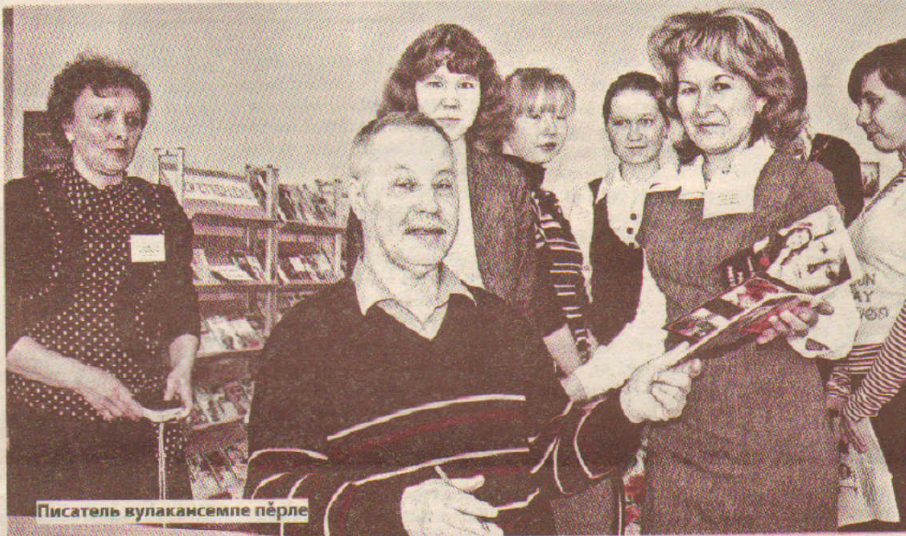
Писатель вулакансемпе пёрле

– Часах «Сулăнчак» ятлă сёне роман пичетленсе тухмалла. Романсене «Раçсей ячёпе сырнă реквиём» тесе шухăшлатăн. Чăвашлăх пирки шухăшлани те пулнă ёнтё, халăх шучё чакса пыни те. Кайран «Тан таппинче» колхозсем, ялсем аркани, юханни тухса тăрат. «Авартă» – политика ытларах, чăваш интеллигенцийё. Анчах кашни роман вёсёнчех самрач ачасем сураласчё, пурнăс малалла каят. Сёршыван малашлăхне, манаслăхне, тен, сав халхи пексенче курма пулат? Пётёмпе ма-